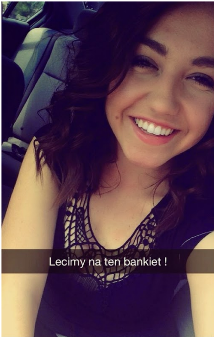
Lecimy na ten bankiet !